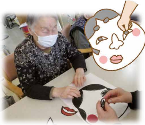
「アップーズがやって来た！」