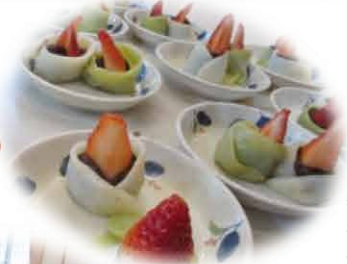
「おひな様のイチゴ大福」