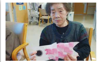
創作活動「手作り鯉のぼり」

4月16日（木）、4月18日（土）の二日間に、お花見と昼食会を行いました。 桜は満開でしたが、天候があまりよくなく桜の下で記念撮影とおやつを食べ、ホームの中 での昼食会となりました。